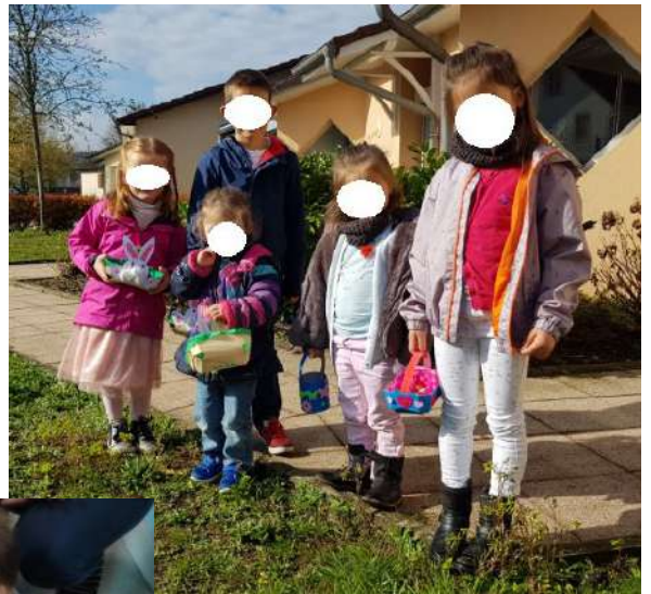
Chasse aux œufs