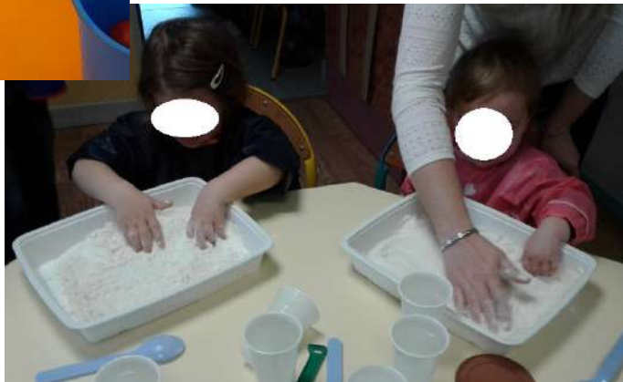
Patouilles et pâte à sel