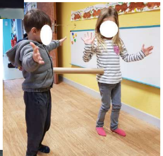
Bouge ton corps