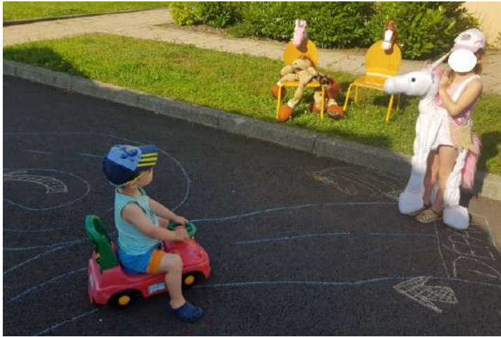
Courses en folie Jeux géants