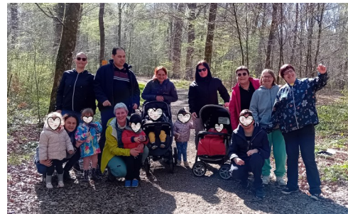
Sortie nature avec les Éparses