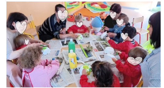
Avant la course aux œufs fabrication des paniers de Pâques