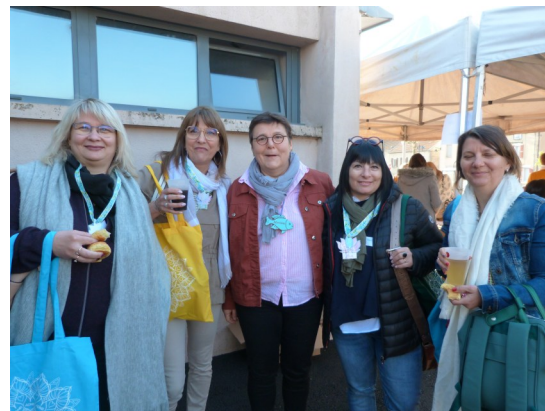
Les AM de la CCRC présentes