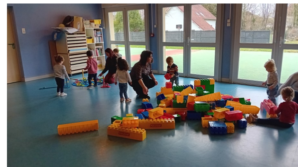
Semaine Nationale Petite Enfance avec les Eparses