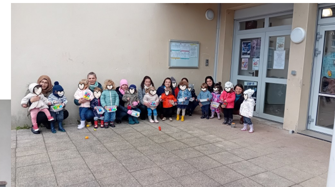
Chasse aux œufs