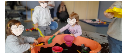
Bac sensoriel printemps