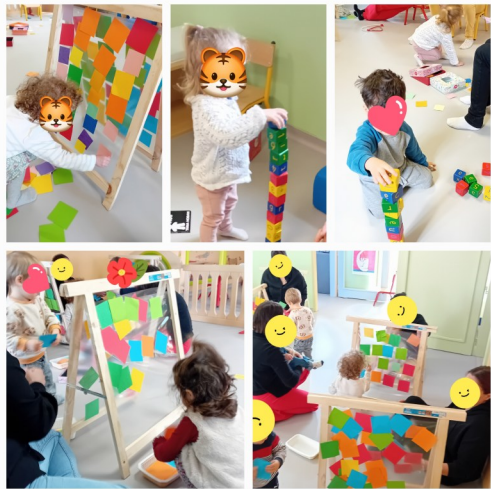
La vie des petits carrés