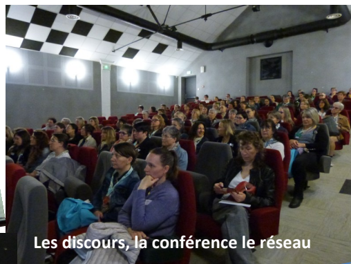
Les discours, la conférence le réseau