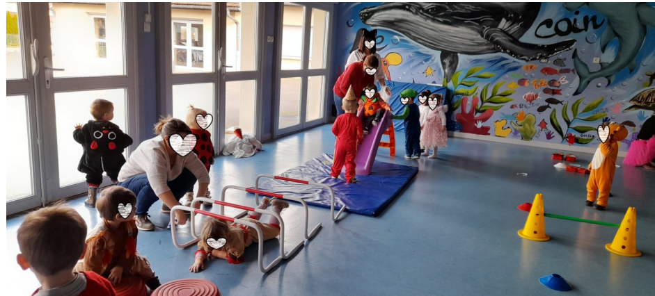
Carnaval et motricité