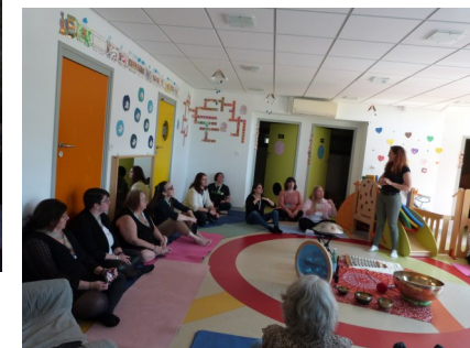
Les ateliers: sono thérapie, yoga, cohérence cardiaque, naturopathie, approche Snoezelen, Dôme à mômes, atelier créatif avec la médiathèque