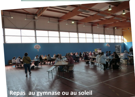
Repas au gymnase ou au soleil